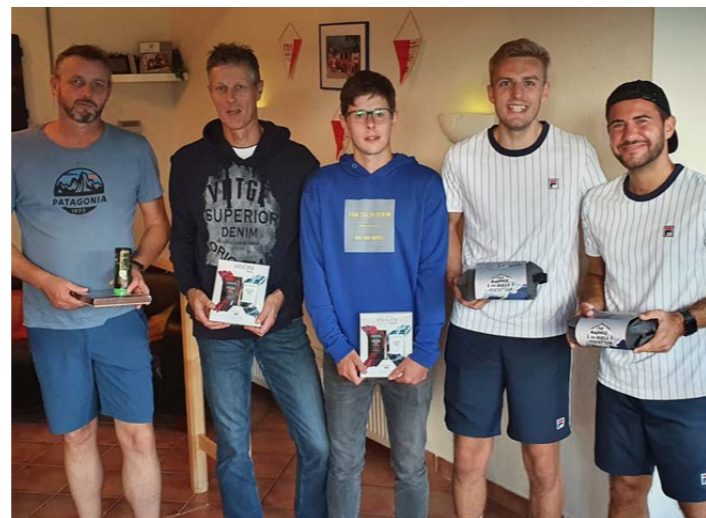
Vereinsmeister Doppel Herren