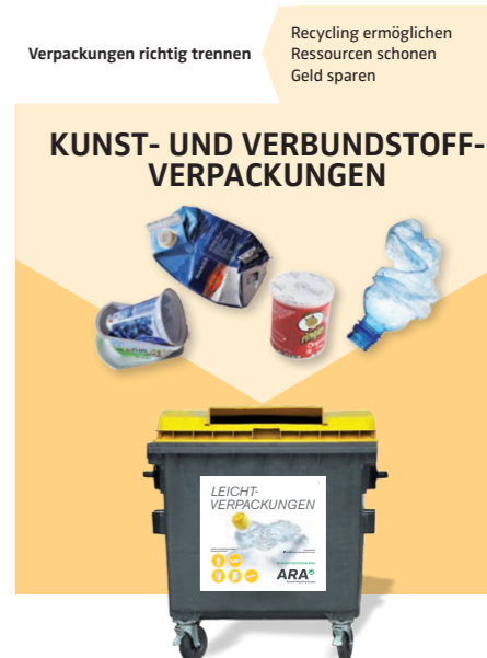
Eine Information Ihrer Gemeinde und der ATM-Abfallwirtschaft Tirol Mitte.

Gewerbebetriebe haben die Möglichkeit, sich an die örtliche Haushaltssammlung anzuschließen. Dafür können kostenpflichtig geeignete Sammelsäcke oder Sammelbehälter direkt bei der Firma DAKA unter der Rufnummer 052142/6910 angefordert werden. Die Sammlung und Entsorgung erfolgt kostenlos. Die genauen Rahmenbedingungen sind bei der Fa. DAKA zu hinterfragen! Die Termine für die Abholungen