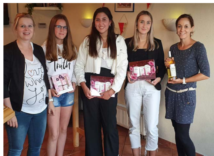
Vereinsmeister Doppel Damen