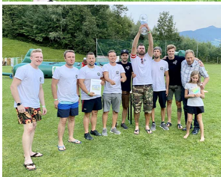
Im Bild stellvertretend die Siegermannschaft „Die Unverbesserlichen“.