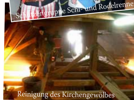
Reinigung des Kirchengewölbes