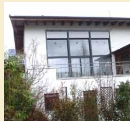
Wohnhaus in Wiesing Bergacker

Wir möchten uns bei Allen, die uns in der Gemeinde unterstützen, herzlich bedanken. Ein großes Dankeschön auch unseren Nachbarn, die uns das Gefühl geben, willkommen zu sein.