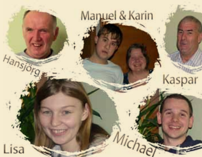
Unsere Bewohner in Wiesing