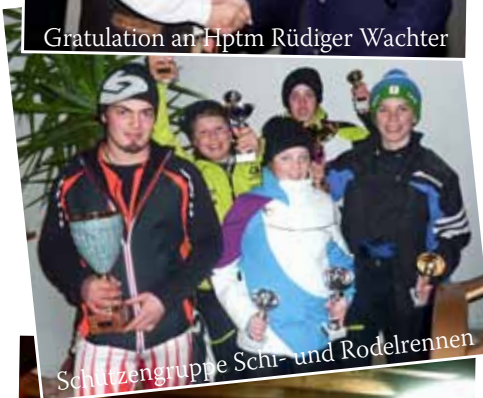
Schützengruppe Ski- und Rodelrennen